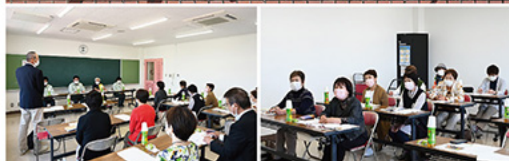
▲大竹市シルバー人材センター視察研修

当センターの福祉家事援助推進委員会では10月6日(水)に大竹市シルバー人材センターが運営している「紫苑」で視察研修を行いました。