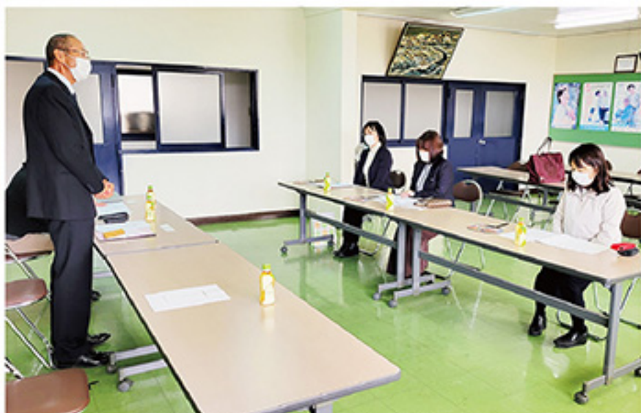
▲県連合会福祉家事援助サービス事業推進委員の拠点訪問

また、11月16日(火)には県連合会福祉家事援助サービス事業推進委員の拠点訪問があり、女性会員拡大への取組み等の意見交換を行いました。