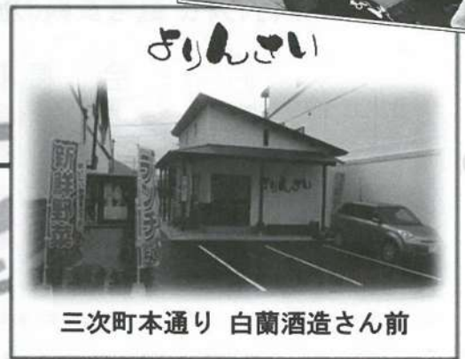
三次町本通り 白蘭酒造さん前